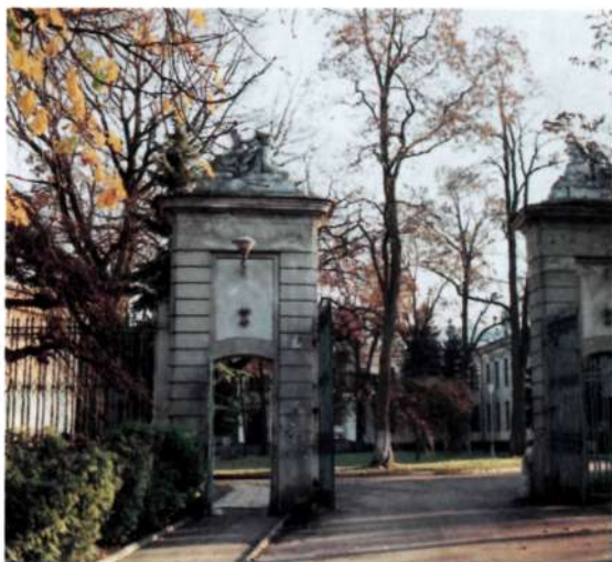
Гродзенскі дзяржаўны гісторыка- археалагічны музей.

The Grodno State Historico- Archaeological Museum.