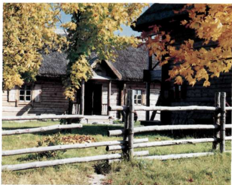
Музей-сядзіба Міцкевічаў «Завоссе».

The Museum- Manor of the Mitskevichs «Zavosse».