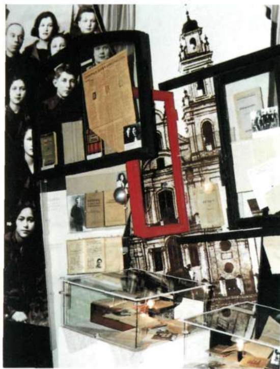
Літаратурна- дакументальная выстаўка «По- кліч» Дзяржаў- нага музея гісто- рыі беларускай літаратуры.

Literary-documen- tary Exhibition «Call» of the State Museum of the History of Belarusian Literature.