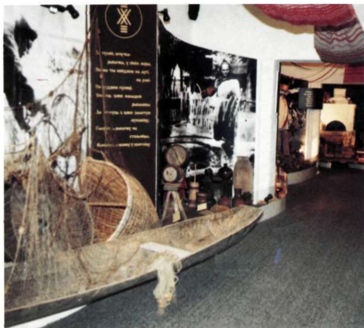
Экспазіцыя Музея народнай культуры Мазыршчыны «Палеская веда».

The Grodno State Historico- Archaeological Museum.