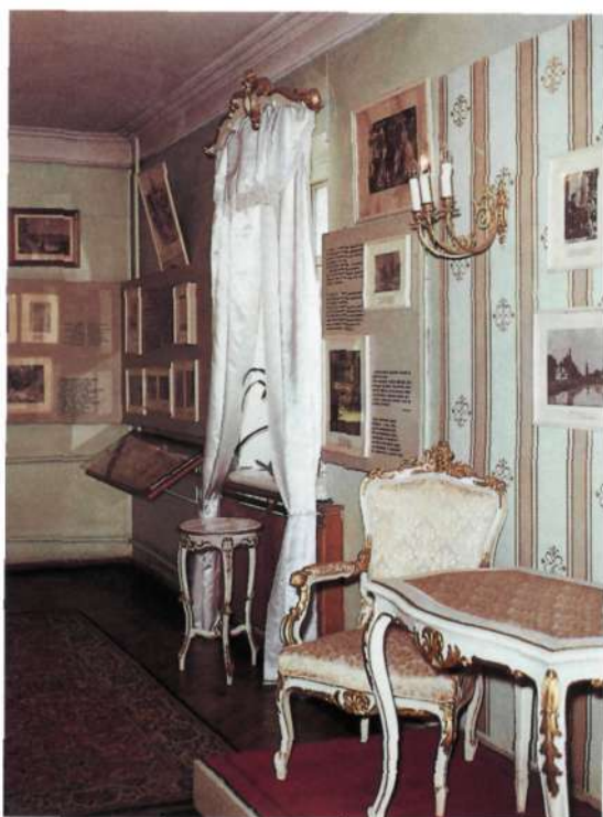
Фрагмент экспазіцыі Дома-музея А. Міцкевіча ў Навагрудку.

The Museum- Manor of the Mitskevichs «Zavosse».